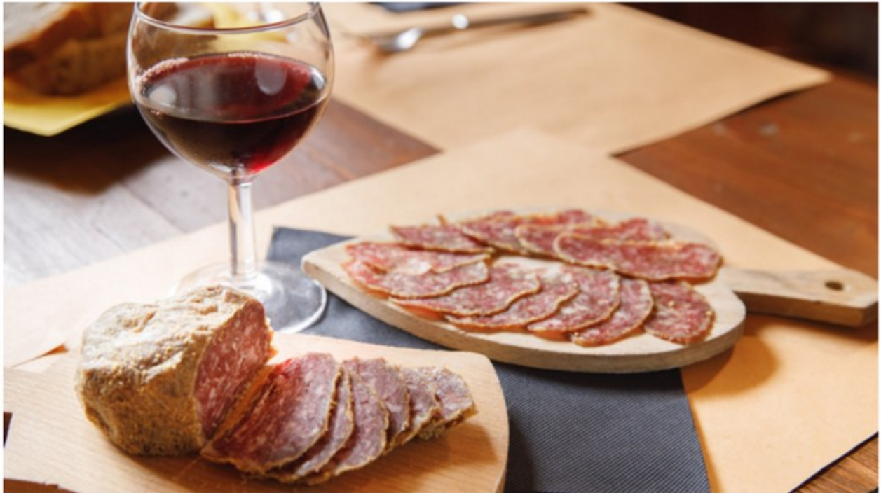
Festa della Pitina

Sabato e domenica Tramonti di Sopra ospiterà la nuova edizione della Festa della Pitina, un evento unico dedicato alla tradizionale polpetta affumicata del Friuli Venezia Giulia, riconosciuta IGP e primo presidio Slow Food della regione. Nel suggestivo borgo della Val Tramontina, la festa si trasformerà in un Mercato della Terra, dove oltre quaranta produttori locali e internazionali offriranno degustazioni delle