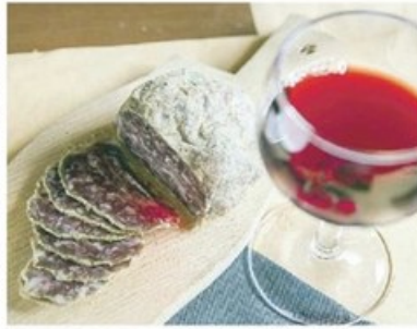
IN TAVOLA Sabato e domenica a Tramonti di Sopra sarà protagonista l'enogastronomia: pitina ospite d'onore

Ci saranno degustazioni, incontri e presentazioni: sabato alle 14 degustazione sensoriale guidata con i prodotti del merca-